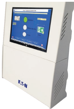
CGLine+ Touchscreen Controller