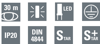
Brillant 1804 LED CG-S