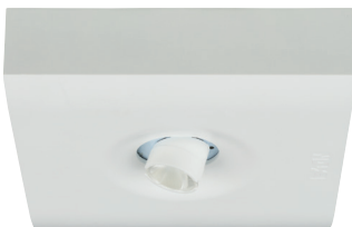
GuideLed SL 13052.2 CG-S