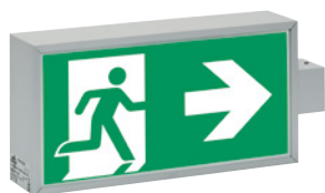
71821 CGLine+ WM mit Scheibe PR