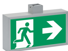
Maßangaben in mm