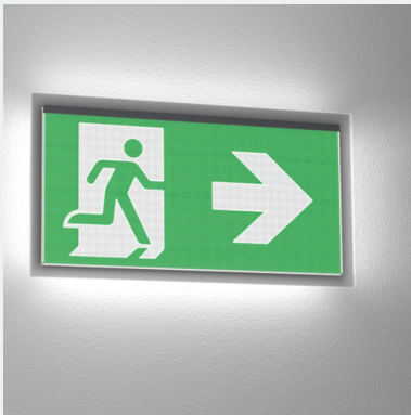
Bild zeigt Montagevariante