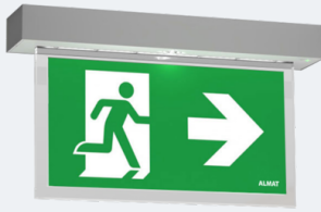
Bild zeigt Montagevariante