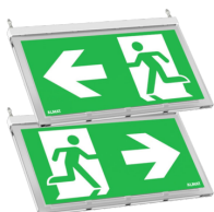
Piktogramm STELLA 1 15 DA/DE LA, PL/PR