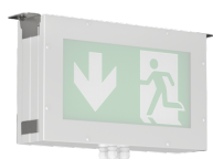
ROBUSTO II E40 MW 2s 90D D