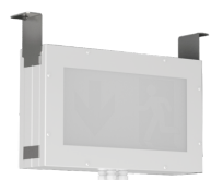
ROBUSTO II E40 MW 2s 90D A