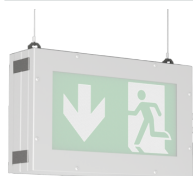
ROBUSTO II E40 MW 2s SK