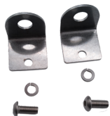
ROBUSTO II E35 MW SK