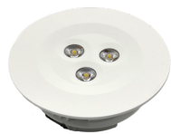
POWER SPOT TS DE, PLC, 0-E