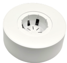
ECO-/POWER SPOT DA R, 0-E