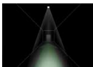
Fluchtwegausleuchtung mit asymmetrischer Optik