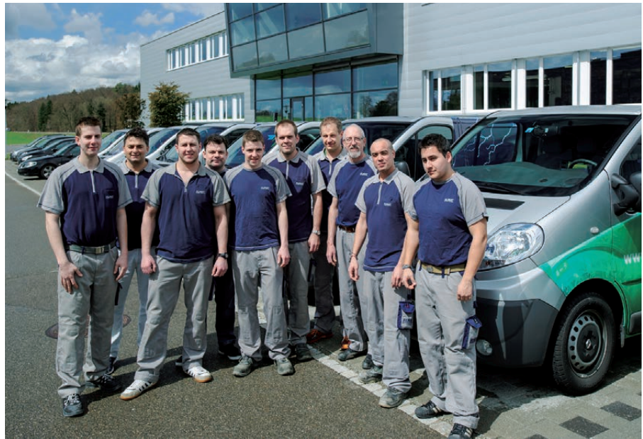
Für Sie im Einsatz

Unsere Service-Techniker unterstützen Sie bei Inbetriebnahme, Störungsbehebung, Akkuaustausch und Wartung/Service.