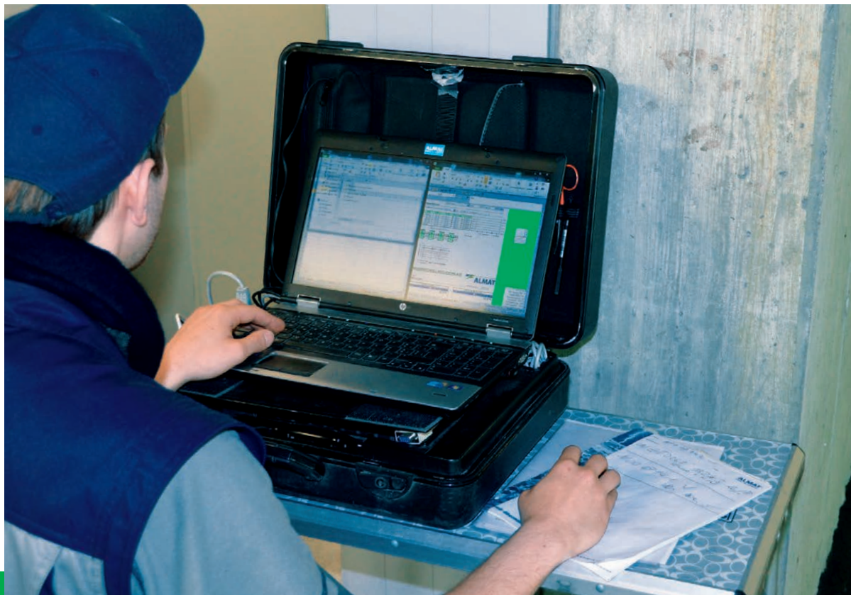
Inbetriebnahme durch unsere Service-Techniker

Die leistungsstarke Visualisierungssoftware CGVision steuert und überwacht solche Objekte mit höchster Zuverlässigkeit. Eine individuelle Programmierung, Einführung und Inbetriebnahme dieser Software CGVision durch unsere Service-Techniker ist Ihnen garantiert. Bitte sprechen Sie uns an.