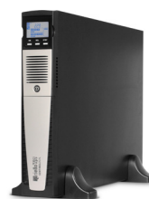
Sentinel Dual Low Power SDH