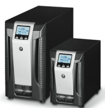
Sentinel Pro SEP

Le possibilità d'impiego dei nostri impianti UPS nell'intervallo di potenza da 700 VA a 10 kVA sono quasi illimitate. Sono ideali per attività d'ufficio e ambienti server di piccole dimensioni, dove è richiesta una potenza medio-bassa, come ad esempio piccoli impianti nelle infrastrutture, nell'industria, nel settore farmaceutico e nella medicina.