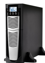
Sentinel Dual High Power SDU