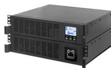
Sentinel Rack SER